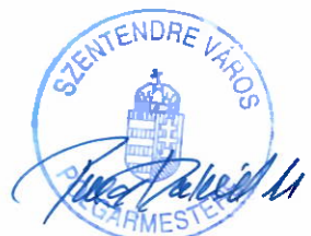
Fülöp Zsolt Polgármester

Minden szükséges információt a pályázati kiírás tartalmaz, amely a Városfejlesztési és Vagyongazdálkodási Irodán vehető át és a www.szentendre.hu/ingatlanportal internetes oldalról tölthető le. Tájékoztatás telefonon: 26/785-057