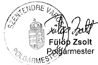
Fülöp Zsolt Polgármester

Minden szükséges információt a pályázati kiírás tartalmaz, amely a Városfejlesztési és Vagyongazdálkodási Irodán vehető át és a www.szentendre.hu/ingatlanportal internetes oldalról tölthető le. Tájékoztatás telefonon: 26/785-057