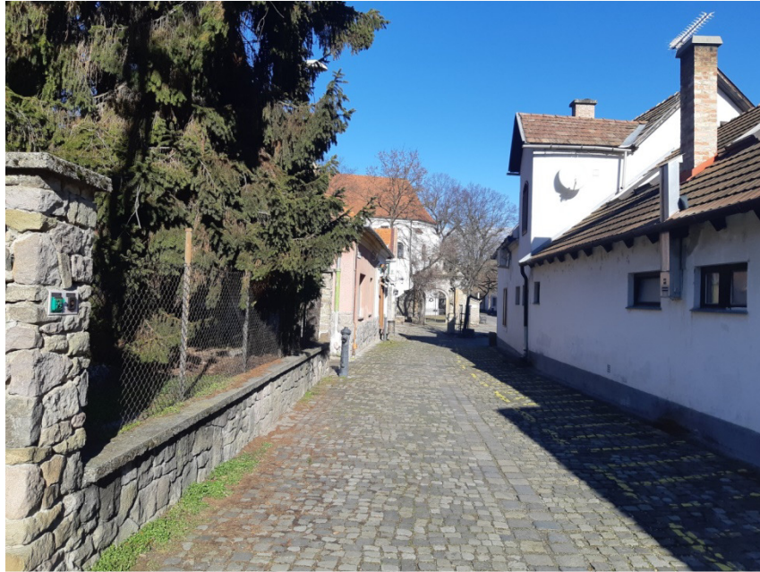
2-1-0 jelű ág építési helye a Szerb utcában

A csapadékvíz-csatorna kivitelezése előreláthatóan két ütemben valósul meg.