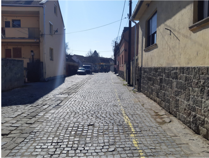
2-0-0 jelű ág építési helye a Bogdányi utcában, az Alsóhegy utca – Középhegy utca közötti szakaszon