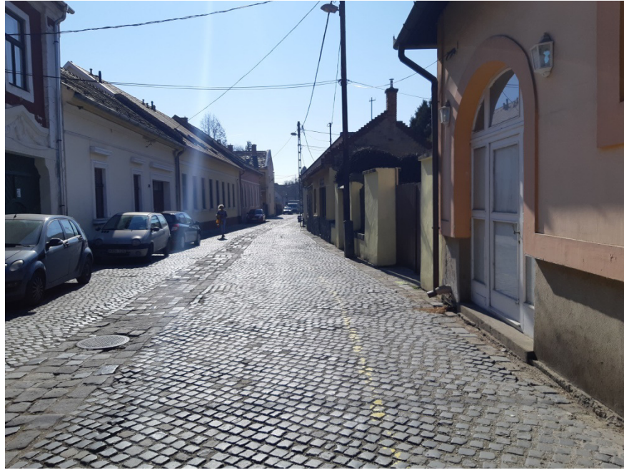
2-0-0 jelű ág építési helye a Bogdányi utcában, a Középhegy utca - Felsőhegy utca közötti szakaszon