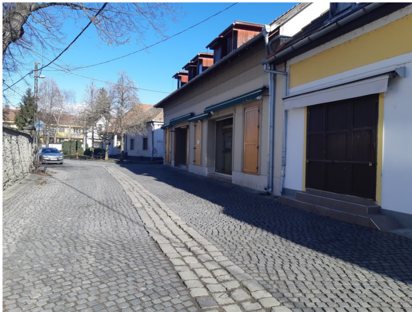
2-0-0 jelű ág építési helye a Bogdányi utcában (Halász utca és Dunaár utca között)