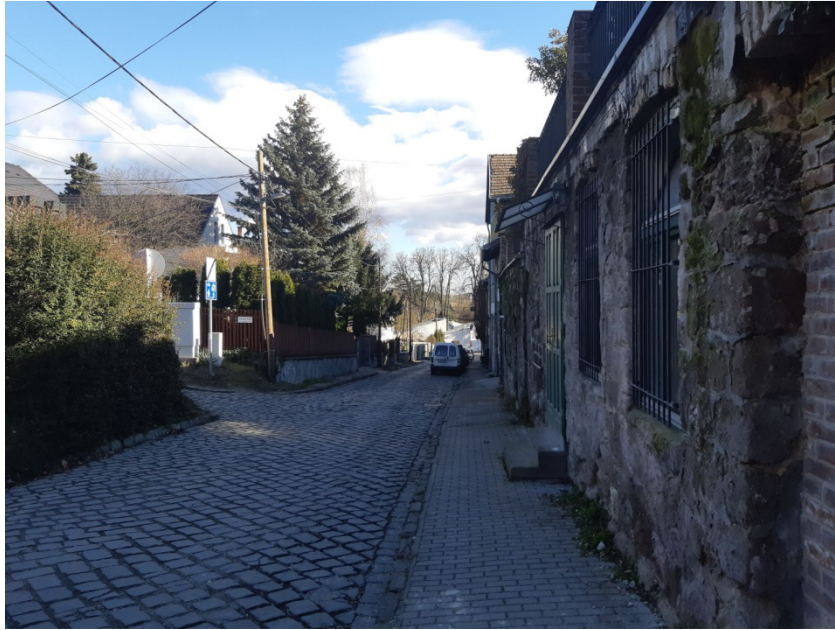
1-0-0 jelű ág építési helye a Dézsma utcában (Ilosvay Varga utca és Ábrányi Emil utca között)