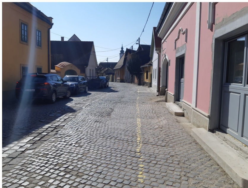
2-0-0 jelű ág építési helye a Bogdányi utcában, a Felsőhegy utca – Dézsma utca közötti szakaszon