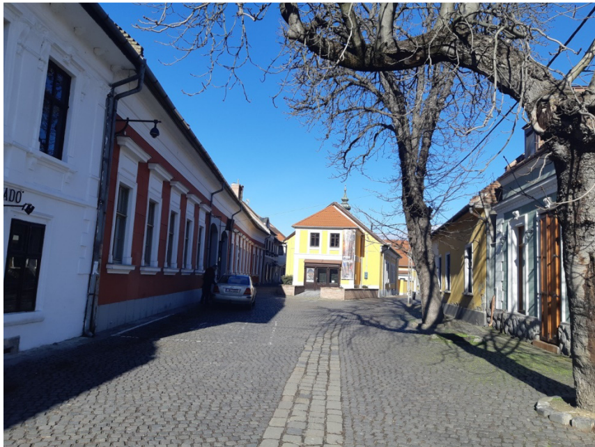
2-0-0 jelű ág építési helye a Bogdányi utcában (Tinódi köz és Szerb utca között)