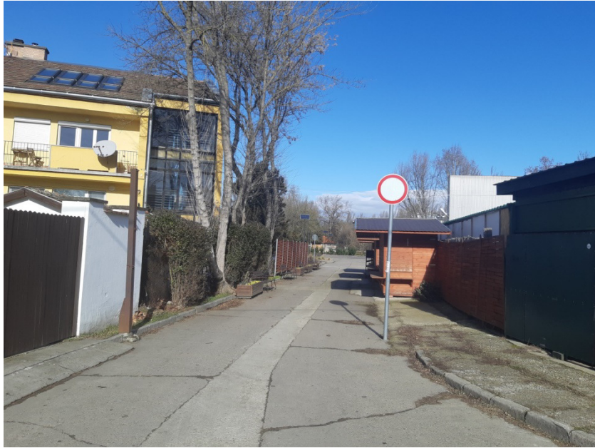
2-0-0 jelű ág építési helye a Teátrum utcában és a buszparkoló felé