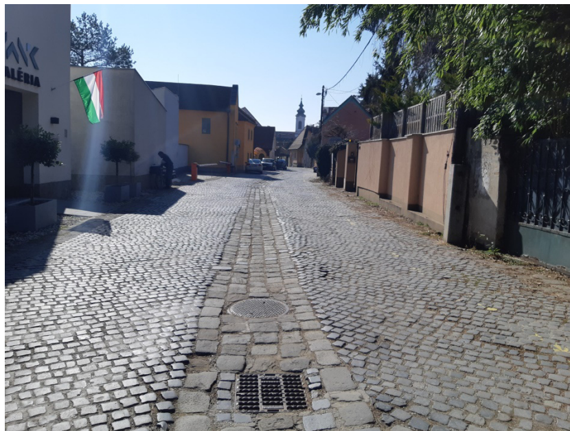
2-0-0 jelű ág építési helye a Bogdányi utcában, a MANK Galéria előtti szakaszon

A 2-1-0 szelvényszámú csapadékvíz rendszer a Bogdányi út déli részén indul, a Szerb utcánál csatlakozik a 2-1-1 szelvényszámú rendszer, majd a Rév utcánál csatlakozik a 2-0-0 szelvényszámú csapadékvíz-elvezető rendszerhez. A 2-1-0 gyűjtőterülete 2,57 hektár. A Bogdányi úton DN315 KG PVC átmérővel indul a rendszer. A Szerb utca déli részénél bővül DN400 KG PVC nagyságra, ami a Szerb utca északi részén történő 2-1-1 szelvény becsatlakozás után DN500 KG PVC nagyságra változik. A szakasz a Rév utcánál csatlakozik a 2-0-0 szelvényszámú csapadékvíz-elvezető rendszerhez.