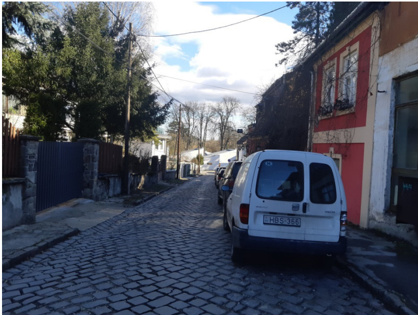
1-0-0 jelű ág építési helye a Dézsma utcában (Ábrányi Emil utca és a Bogdányi út között)

Az tervezett vezeték a Darupiactól DN400 KG PVC vezetékkel indul. Apród utca becsatlakozását követően bővíti DN500 KG PVC nagyságra. Az Ady Endre úthoz érve iránytörés következik, amin a 1933 hrsz-ú területig halad. Itt újabb iránytörés következik, illetve az utca folytatásában egy záportározót helyeznek el. A 1933 hrsz-ú területen a lecsökkent lejtés miatt újabb dimenzióváltást kellett alkalmazni. Innentől DN630 Pragma csővel megy tovább a víz az I. számú csapadékvíz átemelőig.