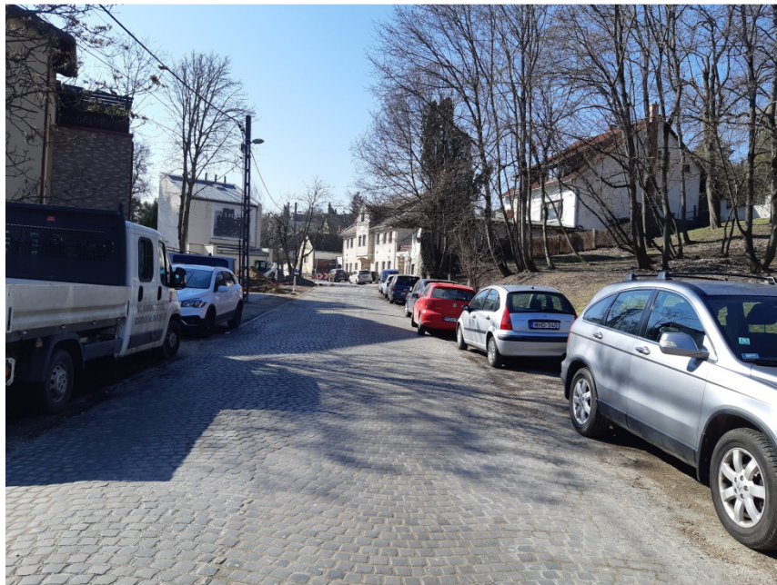
1-0-0 jelű ág építési helye az Ady Endre úton (Dézsma utca és Réti sétány között, záportározó helye)

A 2-0-0 szelvényszámú csapadékvíz rendszer a Bogdányi út északi részén indul, a Rév utcánál iránytörés következik, majd a Teátrum parkolón keresztül eljut az I. számú csapadékvíz átemelőig. A 2-0-0 gyűjtőterülete 4,25 hektár. A Bogdányi úton a rendszer DN315 KG PVC indul. A Felsőhegy utca befolyás után bővül DN400 KG PVC nagyságra, ami az Alsóhegyi útig tart. Az itt érkező nagy intenzitású felszíni csapadék miatt DN500 KG PVC nagyságra bővül. A Rév utcánál iránytörés következik, majd csatlakozik a 2-1-0 szelvényszámú csapadékvíz-elvezető rendszer. Innentől DN630 Pragma csőben folyik tovább a csapadékvíz 2 db újabb iránytöréssel az I. számú csapadékvíz átemelőig. A vezetékek végig min. SN8 osztályúak.