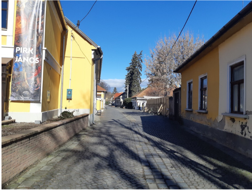
2-0-0 jelű ág építési helye a Bogdányi utcában (Bem utca és Halász utca között)