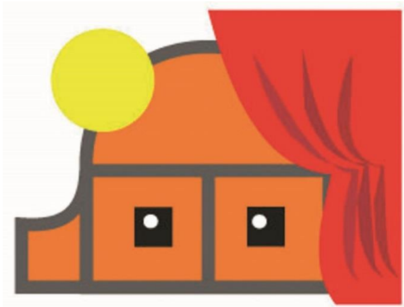
Az új logó: