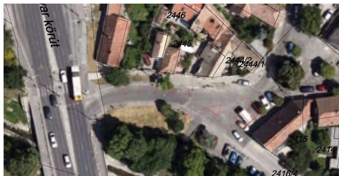
Tervezett parkolóhelyek a Bükkös part elején és az utcatorlatnál

A Bükkös part elején a 11-es főútról való lekanyarodás után az út bal oldalán - a melléklet rajz szerint – négy parkolóhely felfestése. A parkolási automatánál lévő parkolási övezetet jelző tábla kerüljön egy oszlopra az előrébb lévő „Kamerával megfigyelt terület” táblájának az oszlopára. A Bükkös part - Tiszteletes u. - Rákóczi u. elágazástól jobbra lévő területen – az ott lévő épület gerincére merőleges beállással - kerüljön felfestésre a burkolaton szintén négy parkolóhely. A forgalombiztonság érdekében kerüljön még felfestésre a három út elágazásánál egy burkolati forgalmi háromszög” valamint a Rákóczi utca és a Bükkös part szélét jelző „optikai szaggatott vonal”.