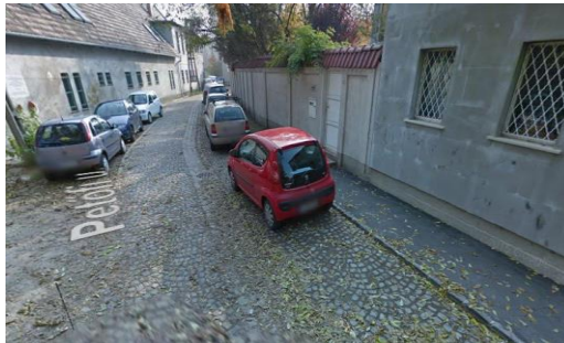
Jelenlegi parkolás a Petőfi utcában

A Petőfi utca jobb oldalán a járda mellett, de sokszor a járdán is parkolnak gépkocsikkal, – kihasználva a díjmentes övezet előnyét – ugyanakkor akadályozzák a kétirányú forgalmat, mert csak egy sáv marad szabadon. A kétirányú forgalomra szükség van a Petőfi utca belső részében lakók autójával való közlekedése miatt.