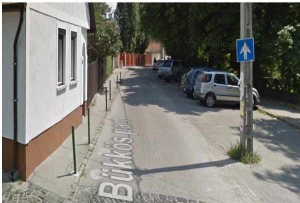
Meglévő oszlopok a Bükkös part elején

A már kialakított rendszernek megfelelően további oszlopok elhelyezése a járda szegélyénél egészen az óvoda ingatlanáig (Ez kb. 60 m.) Figyelembe véve, hogy az óvoda bejárat előtt van korlát és oszlop, valamint azt, hogy a gépkocsi bejárat elé nem kellene oszlopok így max. 8-9 db oszlop elhelyezésre lenne szükség.