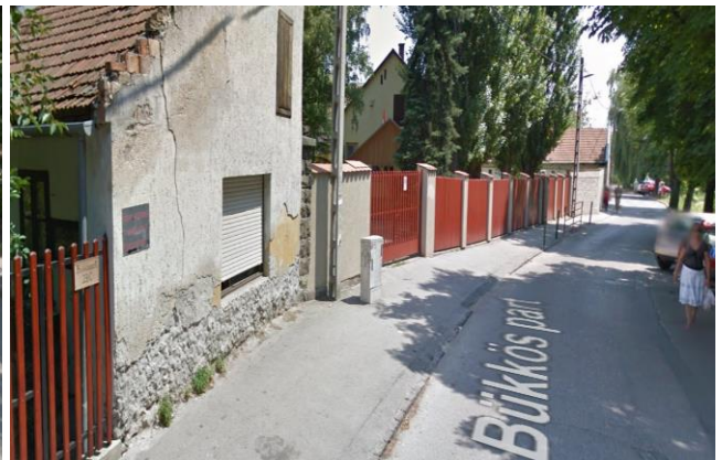
– Oszlopok elhelyezésére váró szakasz