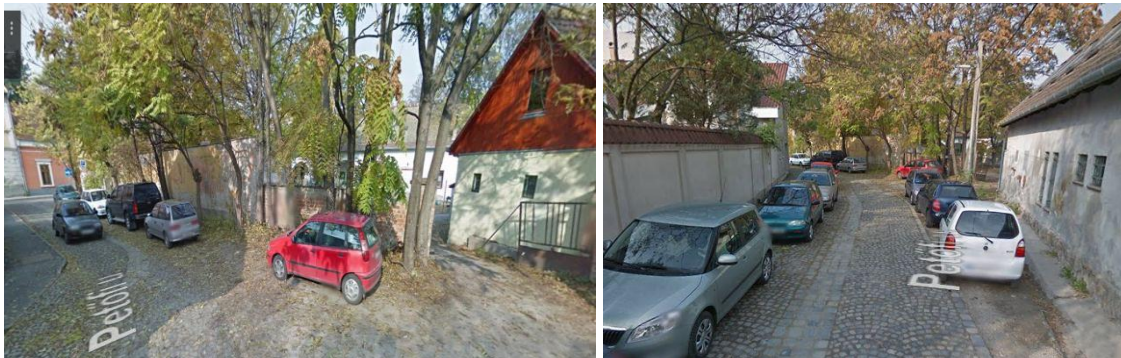
Zúzottkővel kialakított parkolóhelyek az út jobb oldalán és a baloldali parkolás megszüntetése

A Kossuth Lajos utca és a Petőfi utca sarkán lévő Parkolási övezet vége és a másik oldalon lévő parkolási övezet kezdete táblát át kell helyezni a Petőfi Sándor utca kockakő burkolatának végére a megfelelő irány szerint.