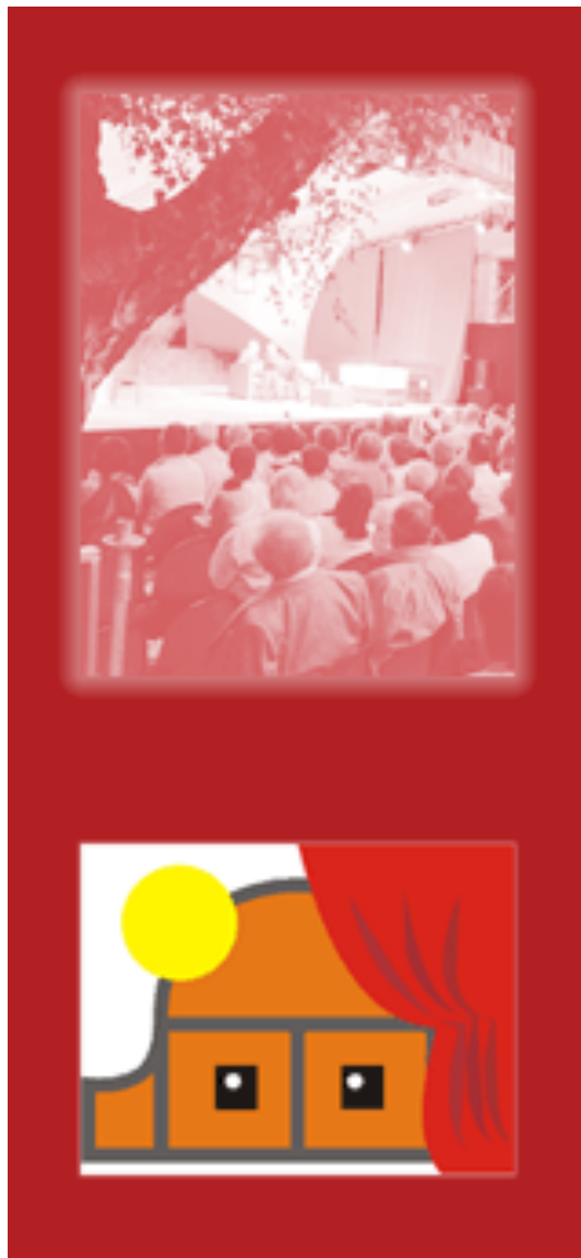
A régi arculat: